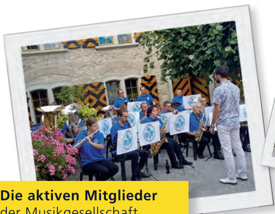
Die aktiven Mitglieder der Musikgesellschaft Rorbis-Freienstein-Teufen

Das Spiel der Musikgesellschaft begeistert Jung und Alt. Und genau so ist auch die Zusammensetzung der Musikanten. Vom Schüler bis zum Pensionär ist das ganze Altersspektrum vertreten. Das ist möglich, weil sich der Verein für die Ausbildung und Förderung junger Musikanten stark einsetzt. Ein Engagement, das wir auch dank guter Unterstützung der Gemeinden Rorbis und Freienstein-Teufen erhalten können und für das wir uns herzlich bedanken.